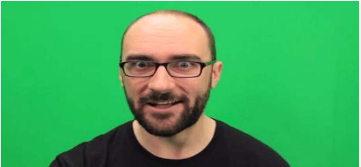
Youtube Vsauce